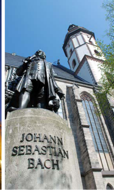
Nikolaikirche (links) und Bachdenkmal (rechts)

Ein ökumenischer Gottesdienst unter freiem Himmel wird am Donnerstag – Christi Himmelfahrt – der geistliche Auftakt sein. Bibelarbeiten und Jugend-Taizé-Nacht laden an den folgenden Tagen alle Interessierten ein, miteinander im Gebet zu sein, zu singen und zu feiern. Tausende Bläser sind in der Stadt. Sie werden Leipzigs Plätze und Straßen zum Klingen bringen. Bevor sie zum Festgottesdienst nach Lutherstadt Wittenberg weiterreisen, findet das Festkonzert der deutschen Posaunenchöre zum Reformationsjubiläum auf großer Bühne in Leipzig statt.