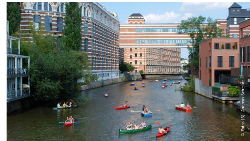
Wasserstraße durch die Innenstadt

Kurzum: Wer schon immer mal nach Leipzig wollte, der sollte sich „auf den Weg“ machen und wird die Stadt vom 25. bis 28. Mai 2017 in ihrer ganzen Schönheit erleben.