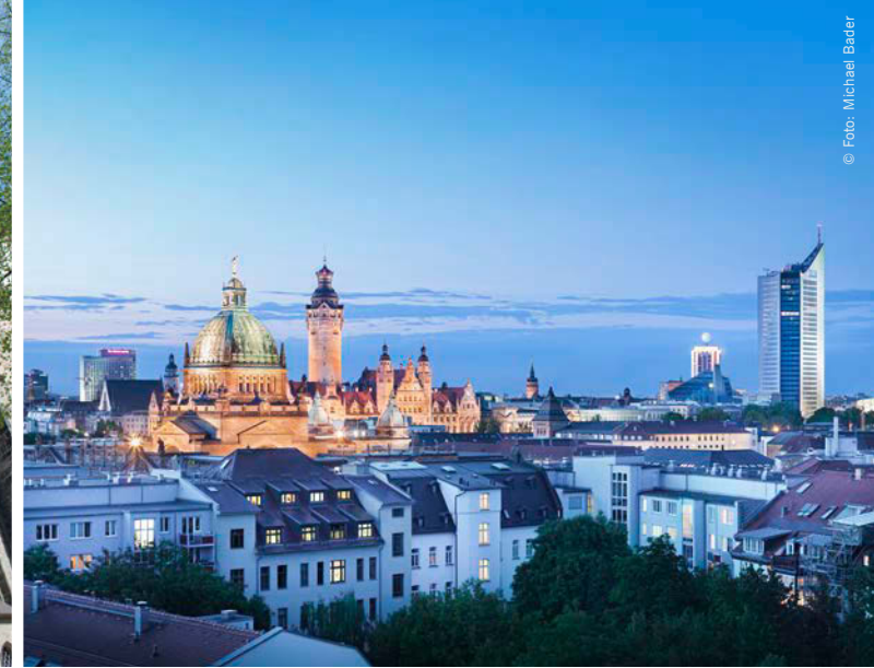
Panoramablick über Leipzig

In Kooperation mit zahlreichen städtischen Partnern sowie der Tourismusorganisation werden an allen Tagen kulturelle, musikalische, diakonische und touristische Highlights für Jung und Alt, für Leipziger und Gäste angeboten. Bands – für alle, die tanzen wollen, Stadtführungen auf Luthers Spuren – für alle, die mehr wissen wollen, das Grassmuseum öffnet seine Türen – für Kinder und Erwachsene und der weltbekannte Thomanerchor lädt zum Konzert. Eine besondere Erfahrung wird es sein, Leipzig auf seinen vielen Wasserwegen zu entdecken.