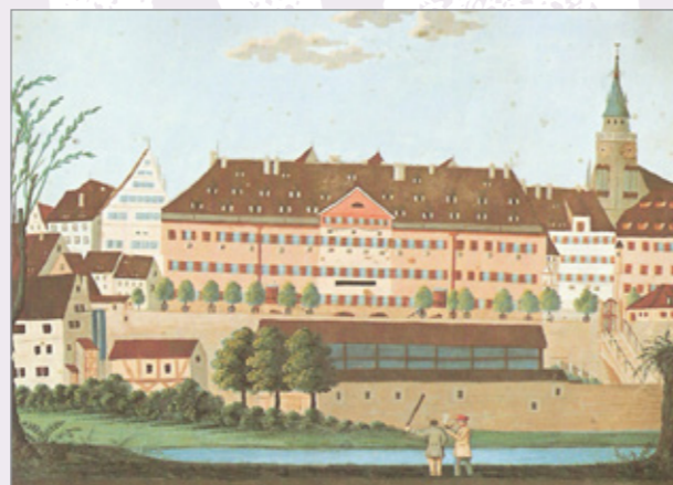
Die alte Burse zu Tübingen, später Klinikum, um 1820